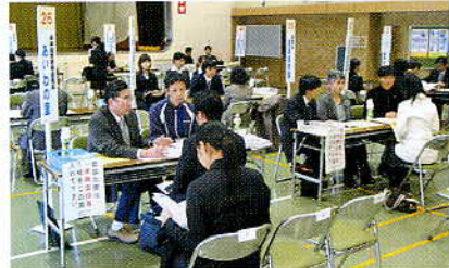
(平成19年2月開催風景)

鹿児島県社会福祉協議会 福祉人材・研修センター 〒890-8517 鹿児島市鴨池新町1番7号 ☎ 099-258-7888 ☎ 099-250-9363 E-mail:jinzai-kyu@kaken-shakyo.jp