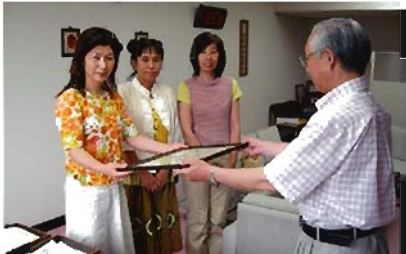
チャリティコンサートの益金を贈呈され、県社協からの感謝状を受け取られる「ルナ ミラクル」の代表のみなさん