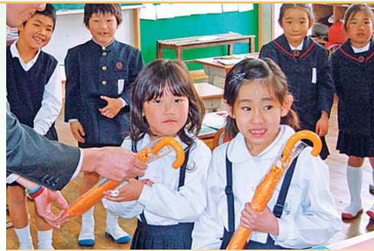
松ヶ浦小学校（南九州市知覧）