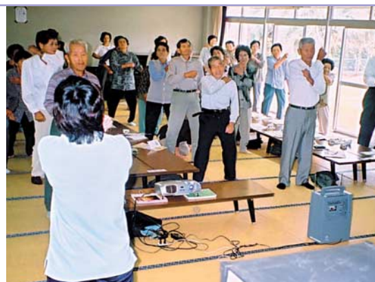
交流研修会（健康体操）

額娃地域においては、福祉センターの利用促進、老人クラブの活性化を図るため老人クラブ会員を対象にした交流研修会を行っています。この交流研修会は、会員の教養の向上、お互いの親睦を深めることを目的としていることから、指導講話や在宅介護支援センター職員による転倒予防教室、カラオケやボランティアの方がたによる踊り、温泉入浴、高齢者の方がたのふれあいの場となるよう内容の充実にも努めています。