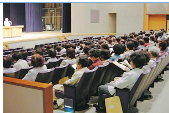
研修会（活動について）