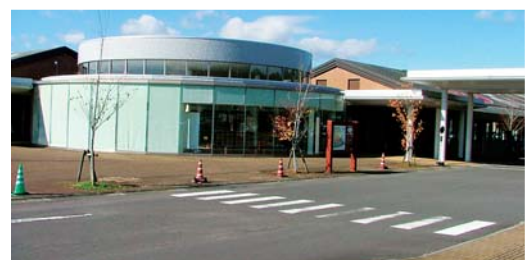
本所のある「まごし館」