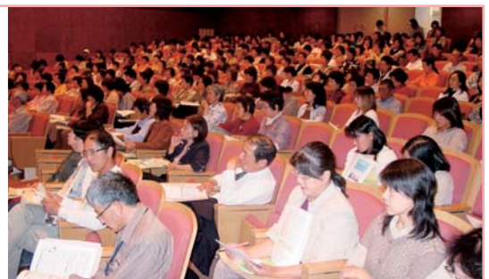
在宅福祉アドバイザー研修会

自治会長の推薦により選出された地域の在宅福祉アドバイザーと協力して援助を必要としている人の把握に努め、住み慣れた家庭・地域で心安らかで安心した生活ができるよう、小地域ネットワーク活動として、声かけ、安否確認などの見守り活動を支援しています。