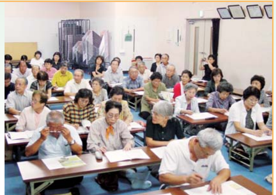
住民座談会の様子

また、住民座談会を市内48地区のコミュニティ協議会で行い、住民参加を得て、策定過程を住民と共有しながら、地域の生活課題や社会資源の状況、地域福祉推進の理念について、連携を図りながら現在課題整理を行っております。