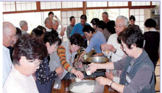
非常炊き出し訓練

講義内容は、日赤救急法や非常炊き出し訓練の実技指導、また、防災対策や高齢者支援についての講話など災害についての知識とボランティア活動について理解を深める講座となりました。