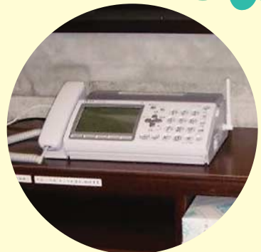
ワイドファックス・棚

昨年度は、障がい者の方が たが利用される県内の小規模 作業所3ヶ所に対し、農園整 備のための倉庫やパソコン・ ワイドファックス等備品購入 に役立てられました。