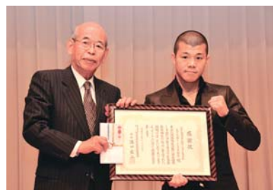
○亀田興毅 様 チャリティーパーティで寄付される WBC世界フライ級チャンピオン 亀田 興毅 様(右)