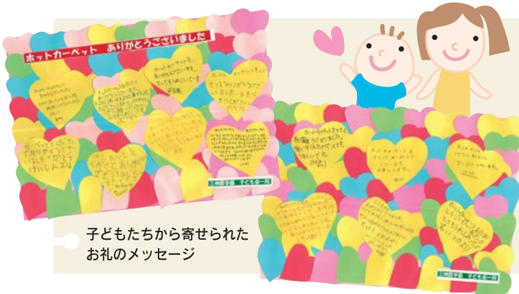
子どもたちから寄せられた お礼のメッセージ

昨年10月1日から12月31日までに共同募金運動にお寄せいただいた募金の総額（一般募金と歳末たすけあい募金）は、3億251万5千円となりました。ご協力いただきました県民の皆様から感謝申し上げます。