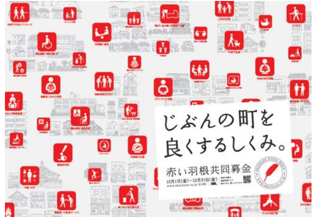
〈平成22年度ポスター〉

今年も10月1日から12月31日まで、赤い羽根共同募金運動が全国一斉に展開されます。この募金が「じぶんの町を良くするしくみ」として、県民の皆様のために活かされますよう、皆様の一層のご支援、ご協力をよろしくをお願いいたします。