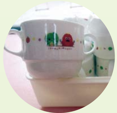
スタッキングマグ・両手マグ