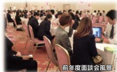
前年度面談会風景