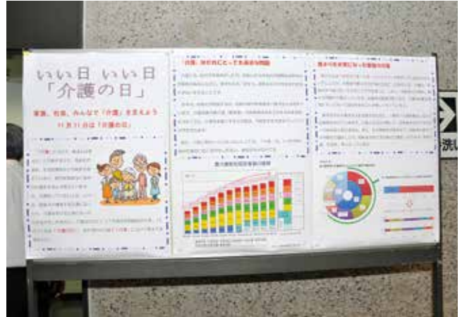
会場ロビーに掲示された介護の日(11月11日)のパネル